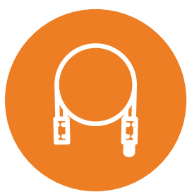
Laveur Désinfecteur d'Endoscopes

Nos prestations sont réalisées en conformité avec l'instruction DGOS/PF2/DGS/VSS1/2016/220 du 4 juillet 2016 et les normes ISO 15883 et EN 16442.