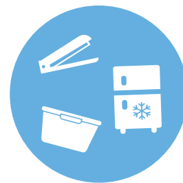
Thermosoudeuses, Bacs ultrasons et Enceintes climatiques