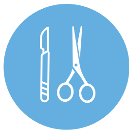
Laveur Désinfecteur d'Instruments