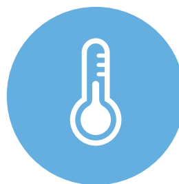
Stérilisateurs basse température