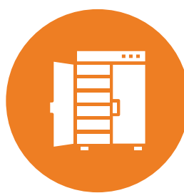
Enceinte de Stockage des Endoscopes Thermosensibles